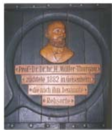
Ein gewisser Hermann Müller aus dem Schweizer Kanton Thurgau, seines Zeichens Rebenforscher, entwickelte 1882 in Geisenheim den nach ihm benannten Weißwein als widerstandsfähige Kreuzung aus Riesling und Silvaner.